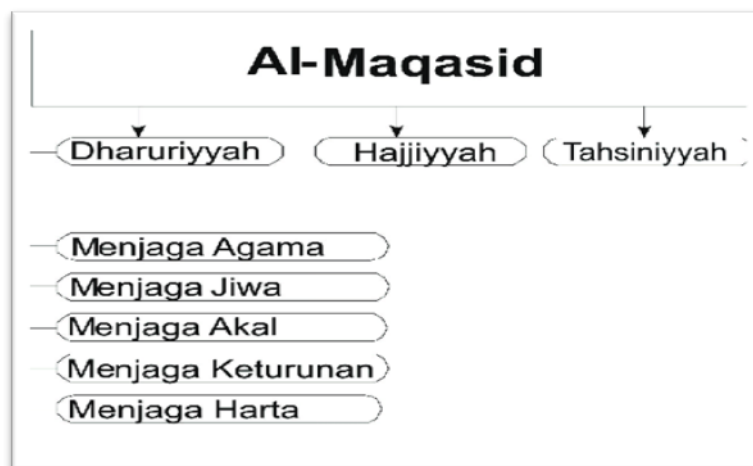
Gambar 1. Skema Maqashid Syariah dalam Evaluasi Keuangan

Pendekatan maqashid syariah juga telah diterapkan pada BPRS, UUS, dan BUS dalam berbagai studi evaluasi keuangan [11]. Pendekatan ini memungkinkan evaluasi yang lebih komprehensif, tidak hanya dari aspek finansial tetapi juga nilai-nilai Islam yang mendasarinya.