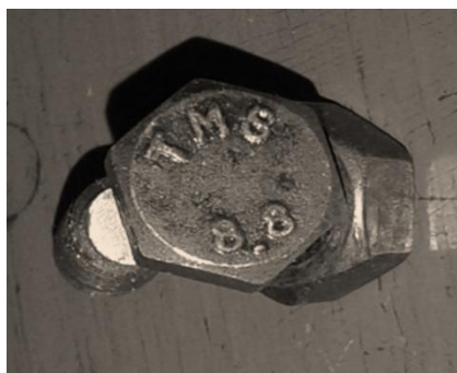
Gambar 1. Baut yang digunakan pada penelitian

Sampel penelitian terdiri atas lima kelompok berdasarkan variasi spasi antar baut, yaitu 20 mm, 40 mm, 60 mm, 80 mm, dan 100 mm. Setiap kelompok terdiri dari empat sampel uji untuk memperoleh data yang lebih representatif. Spesimen berupa sambungan baut ganda pada pelat baja dengan ketebalan 3 mm. Baut yang digunakan adalah baut berulir penuh dengan diameter ulir luar 5,9 mm sebagaimana ditunjukkan pada Gambar 1. Pelat baja yang digunakan sebagai material sambungan disajikan pada Gambar 2.