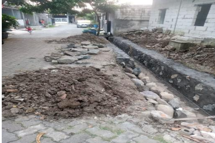
Gambar 4. Saluran Drainase RT.05 RW.09 Pedurungan Lor

Berdasarkan hasil evaluasi bersama masyarakat, kegiatan pendampingan ini memberikan dampak positif terhadap lingkungan RT.05 RW.09 Pedurungan Lor. Saluran drainase yang lebih tertata mampu memperlancar aliran air dan meminimalkan terjadinya genangan saat hujan. Selain itu, kegiatan ini juga meningkatkan kesadaran masyarakat mengenai pentingnya pemeliharaan drainase dan kerja sama warga dalam menjaga kebersihan lingkungan secara berkelanjutan.