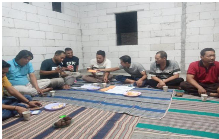
Gambar 3. Diskusi Tim PkM dengan Warga RT.05 RW.09 Pedurungan Lor

Hasil kegiatan menunjukkan bahwa pembangunan saluran drainase baru mampu meningkatkan kelancaran aliran air limbah rumah tangga dan mengurangi genangan air di lingkungan warga. Saluran drainase yang dibangun memiliki dimensi 50 cm × 40 cm × 50 cm sehingga mampu menampung debit air dengan lebih baik dibandingkan kondisi sebelumnya. Kondisi saluran drainase setelah pelaksanaan kegiatan dapat dilihat pada Gambar 4.