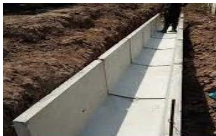
Gambar 2. Saluran Drainase Terbuka